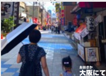
おおさか 大阪にて

先月15日に32歳の誕生日を無事に迎えることができました! 誕生日の数日前から風邪をひいてしまい、苦しい日々が続きましたが、教会の皆様にもお祈りしていただき、当日は完全に快復して家族で旅行に行くことができ、神様の祝福に感謝しています! 過去最多といわれた猛暑日もようやく落ち着き、確かに秋を感じられる季節となりました。教会員の皆様におかれましても、14周年を迎えて、ますます神様の祝福がありますようにお祈り申し上げます。(T 兄)